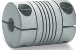
Çeneli Tip (yandan sıkmalı) WAC