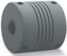
Setuskurlu Tip WA